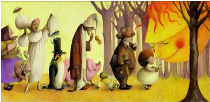
Ilustración interior de Comenoches. Madrid: Alaguara, 2004

En los labios niños, Las canciones llevan Confusa la historia Y clara la pena. Manuel Machado Soledades, VII (fragmento).