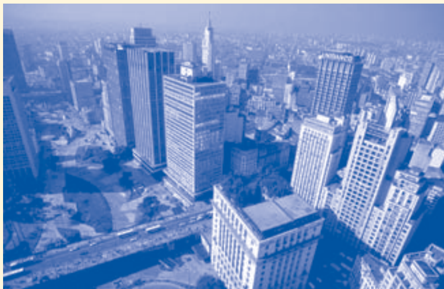
Vista aérea de la región central de la ciudad de São Paulo

COMISIÓN EUROPEA EuropeAid Oficina de Cooperación Dirección América Latina