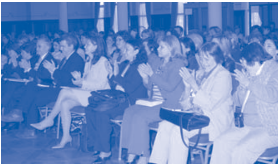
Red 12. Participantes al Tercer Seminario Anual.

El trabajo activo y participativo de los soci@s así como el intercambio de experiencias y de diferentes realidades fue muy interesante y fructífero. Como resultado del debate y la interacción se elaboraron 13 propuestas de proyecto común (disponibles en la página Web de la red http://www.diba.es/urbal12/ ) para presentar en próximas convocatorias de proyectos. ■