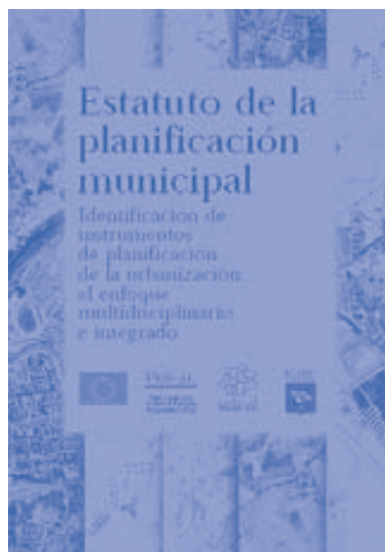
Portada del libro Estatuto de la planificación municipal .

Todos los instrumentos urbanísticos que serán elaborados tendrán que ser tramitados, aprobados y adoptados por las Autoridades Locales, por eso se prevén también talleres de participación con los ciudadanos para difundir las ideas de proyecto e involucrar a la población en la elaboración de los planes.