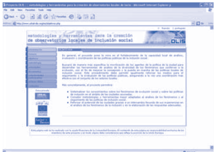
Página Web del Proyecto A.

Este proyecto genera múltiples expectativas en los gobiernos locales socios y otros actores involucrados, comprometiéndose recursos humanos y materiales en contrapartida, para asegurar un desarrollo exitoso del mismo durante los dos años en que se implementarán las acciones previstas. En particular, el Municipio de Montevideo reafirma un compromiso de trabajo en el marco del Programa URB-AL que ha generado resultados positivos, a nivel local e internacional, a partir de una participación activa en dicho Programa desde sus inicios hasta la presente etapa. ■