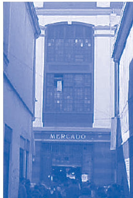
Valparaíso. «Mercado Puerto»

Tendiendo al desarrollo económico y social sustentable a escala de barrios, se trata de generar un modelo de gestión que articule a los actores sociales para el desarrollo integral de su población, en el reforzamiento de su identidad local y de su rol urbano, a través de una Gerencia de Barrios orientada a desarrollar líneas estratégicas que impulsen la consolidación de comunidades fuertes, haciendo factible la participación ciudadana sustentable y la consolidación de un modelo eficiente de gestión de barrios históricos, y haciendo posible la réplica de estas buenas prácticas en los Barrios históricos de las Ciudades Puertos socias del proyecto. ■