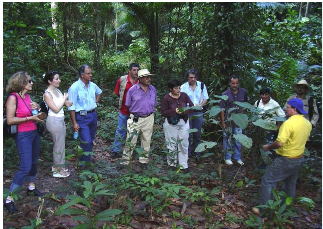
Belém, 12-16 de enero de 2004 – Los socios del proyecto durante una actividad recreativa.