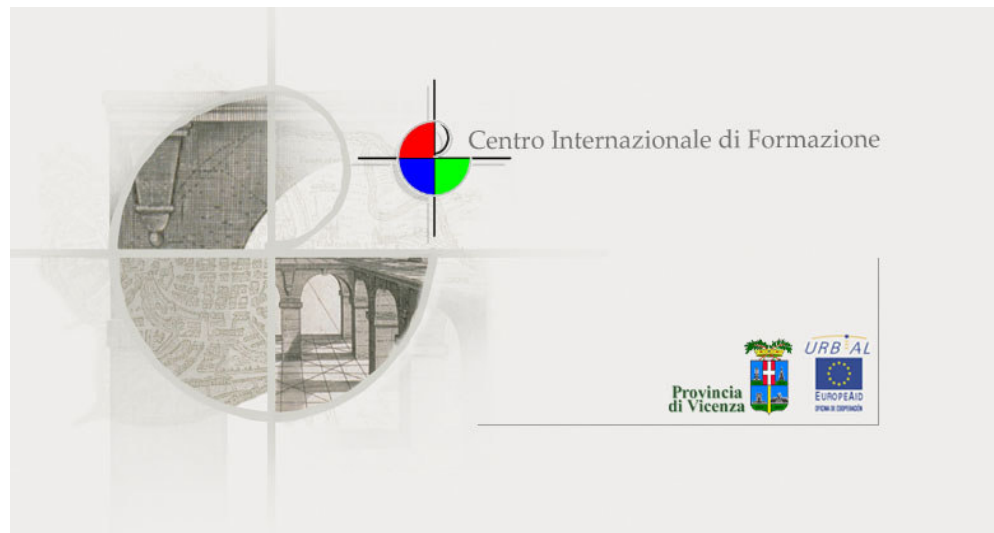
La Home Page del Sitio Web del Centro Internacional de Formación

El calendario completo de los docentes y las fechas de cada materia, serán publicados on line en el Sitio Web del Centro Internacional de Formación y será posible consultarlos en la siguiente dirección: http://urb-al.provincia.vicenza.it/