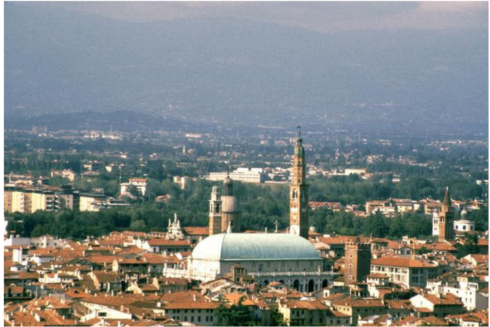
Vicenza – Vista y Basílica Palladiana

El primer trimestre del curso destinado a los jóvenes graduados del Centro Internacional de formación para la valorización y la conservación de los Contextos históricos Urbanos ha terminado. En el curso de esta primera fase se han afrontado los aspectos teóricos del proyecto urbano, con particular atención a las experiencias de recuperación de los centros históricos en las ciudades europeas y latinoamericanas, allí donde conservar y/o revitalizar una parte de ciudad significa disponer de un bagaje de conocimientos coherentes con el "estudio de un orden de su transformación que en la conciencia de la unicidad de cada testimonio y en su carácter documental, maximice la permanencia, agregue la propia marca y reinterprete sin destruir".