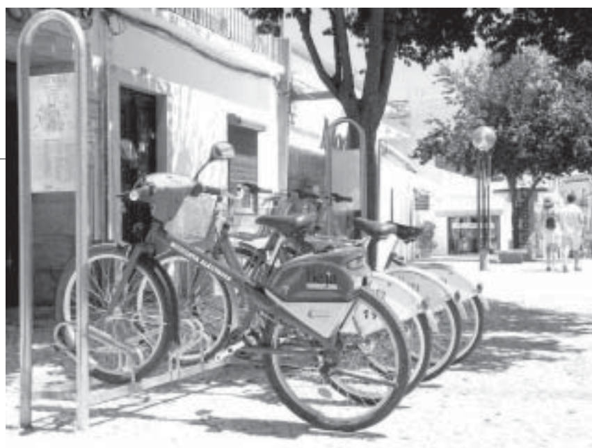
Bicicletas de uso público - Petras