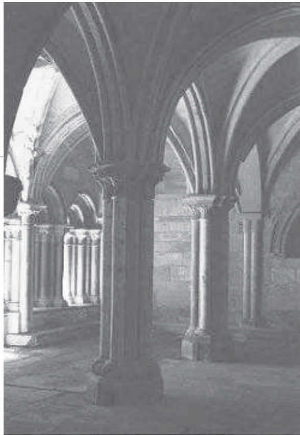
Monasterio de Santa María la Real