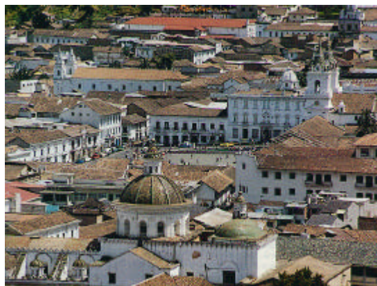
Casco antiguo de Quito

11: Actividades de apoyo relacionadas con la investigación, los estudios de posgrado y la formación en materia de procesos de integración