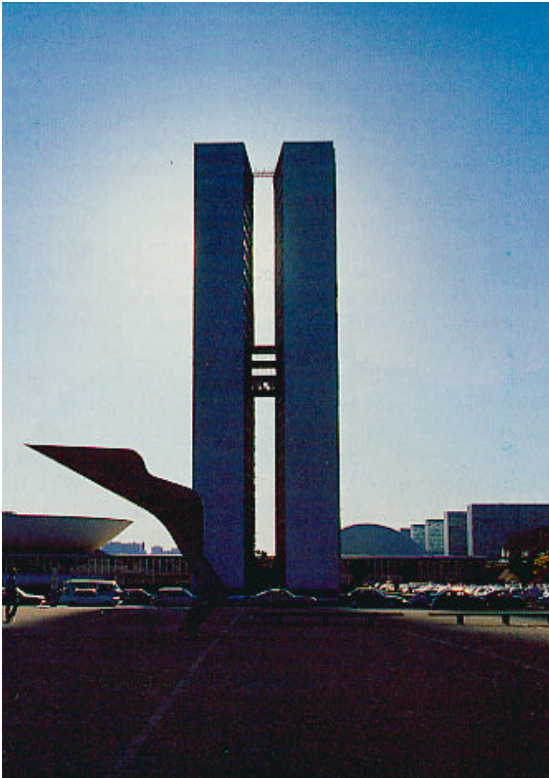
Ciudad de Brasilia

Con MERCOSUR, los progresos sustanciales del proceso de integración en la región, se han traducido en un renovado interés por parte de los operadores económicos europeos. La UE consolida su posición como primer socio comercial y segundo inversor de la región. MERCOSUR se ha convertido en uno de los polos más dinámicos para las exportaciones europeas. En este contexto, la UE analiza nuevas iniciativas en torno a tres grandes ejes: el fortalecimiento del diálogo político, el establecimiento progresivo de una zona de libre comercio y una profundización de la cooperación.