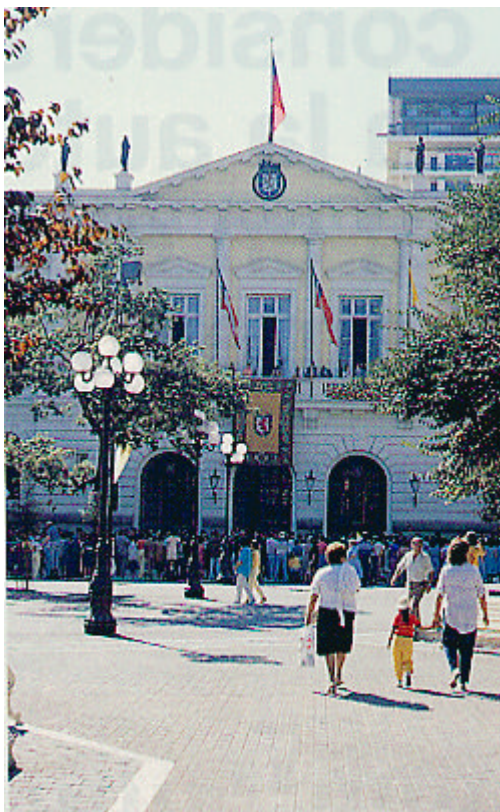
Santiago de Chile

reforzar el respeto de los derechos humanos, del Estado de Derecho y los sistemas políticos democráticos.