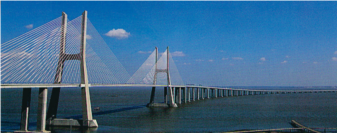
El nuevo puente Vasco de Gama – Lisboa

Oficina de Coordinación Programa URB-AL Red nº4 Antiguo Laboratorio Municipal Calle Bailén 41 28005 Madrid España