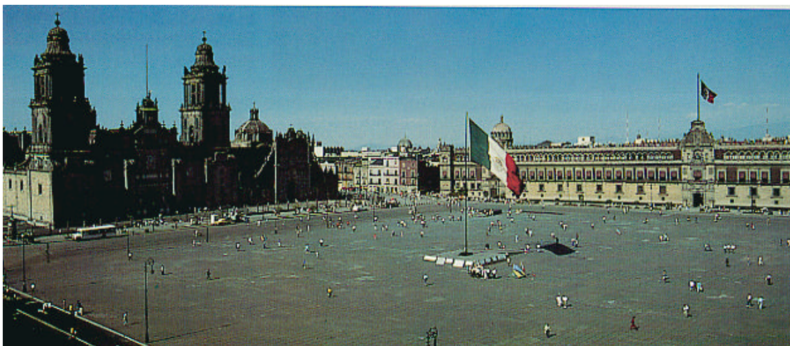
Plaza Mayor de México

Comunicación de la Comisión al Consejo, al Parlamento Europeo y al Comité Económico y Social: sobre una nueva Asociación Unión Europea/América Latina en los albores del siglo XXI