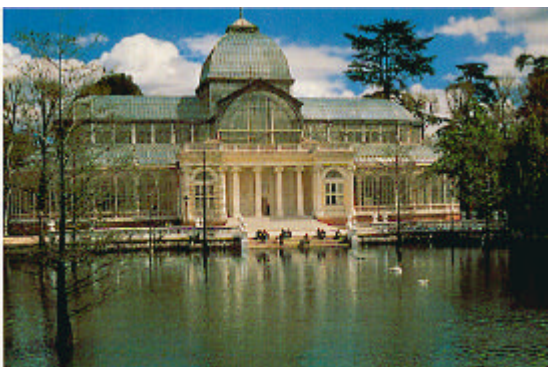
Palacio de Cristal – Madrid

ALIS incluirá una serie de actividades destinadas a crear un entorno propicio para una asociación a largo plazo, centrándose en las siguientes prioridades: desarrollo de infraestructuras, formación de recursos humanos y mejora de los contenidos y aplicaciones.