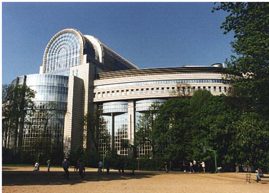
El Parlamento Europeo (Bruselas)

Breve descripción: Diseño de diagnósticos específicos para el sector comercial local, actuando en el ámbito municipal. Detección de recursos, necesidades y nuevas oportunidades de valor añadido. Estudio de factibilidad para la creación en el futuro de un modelo sostenible para la mejora y potenciación del sector en la ciudad.