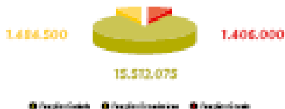
Grandes Opções do Plano de 2007

Em suma, trata-se de um Orçamento que inclui a contratação de serviços de manutenção e limpeza de edifícios, bem como a possibilidade de contratar serviços de manutenção e limpeza de edifícios, bem como a possibilidade de contratar serviços de manutenção e limpeza de edifícios.